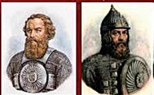
Герои земли Русской